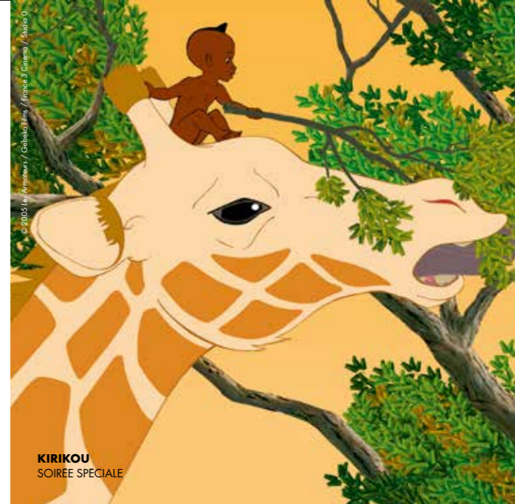
KIRIKOU SOIREE SPECIALE

Une soirée spéciale permettant de prolonger la découverte d'un acteur, d'un réalisateur ou d'un studio de cinéma européen... Une soirée qui se conjuguera au pluriel : deux ou trois films pour mettre en perspective le thème traité. Les icônes du cinéma français avec Alain Delon, Mireille Darc, Jean-Paul Belmondo, Isabelle Huppert ou Jean Dujardin seront assurément au rendez-vous. L'animation à la française ne sera pas oubliée non plus avec, par exemple, Le Roi et L'Oiseau ou Kirikou.