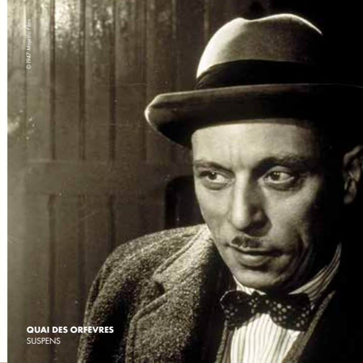
QUAI DES ORFÈVRES SUSPENS

Les films des années 70, 80 et 90 sont coincés dans un angle mort de la cinéphilie moderne : trop anciens pour accéder à la contemporanéité triomphante et trop jeunes pour être déjà inscrits au panthéon des films du répertoire. Mais cette patine intermédiaire a rendu beaucoup de ces films cultes aux yeux d'un public sans cesse renouvelé. Cette case hebdomadaire rendra hommage à ce cinéma très présent dans le catalogue STUDIOCANAL des Golden Years.