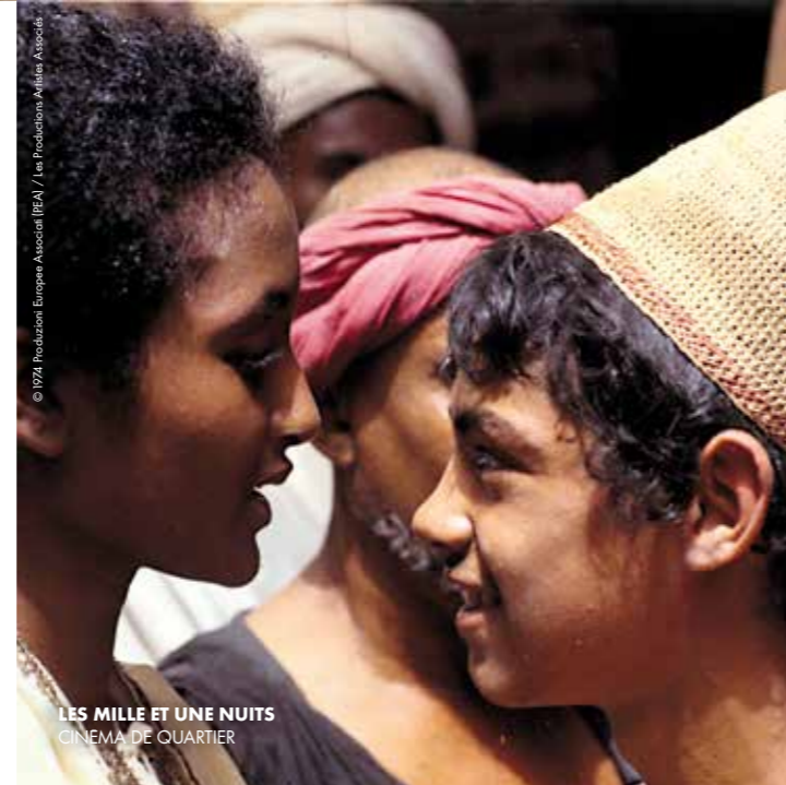
LES MILLE ET UNE NUITS CINEMA DE QUARTIER

Un nom à la fois symbolique pour les cinéphiles des années 50 à 70 et qui reprend à dessein le rendez-vous éponyme de CANAL+. Un espace dédié au cinéma populaire, européen bis et rare. Films d'aventures, de cape et d'épée, gothiques, péplums, westerns, spaghettis, exotiques et autres seront convoqués pour ce rendez-vous d'un plaisir convoicable à partager sans modération.